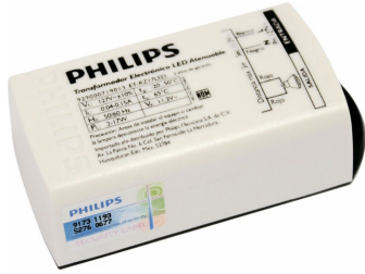
LED Transformer 17 W