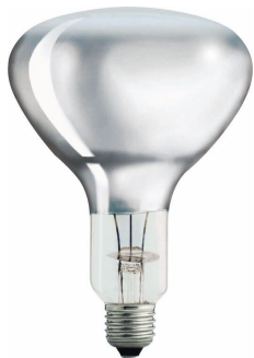
LPPR IRSG E27 R125 Clear