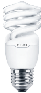
20 W E27