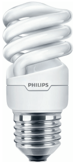
12 W E27