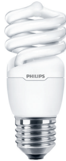
15 W E27